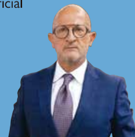
Pedro Sampaio Presidente da Assembleia de Freguesia de Paranhos